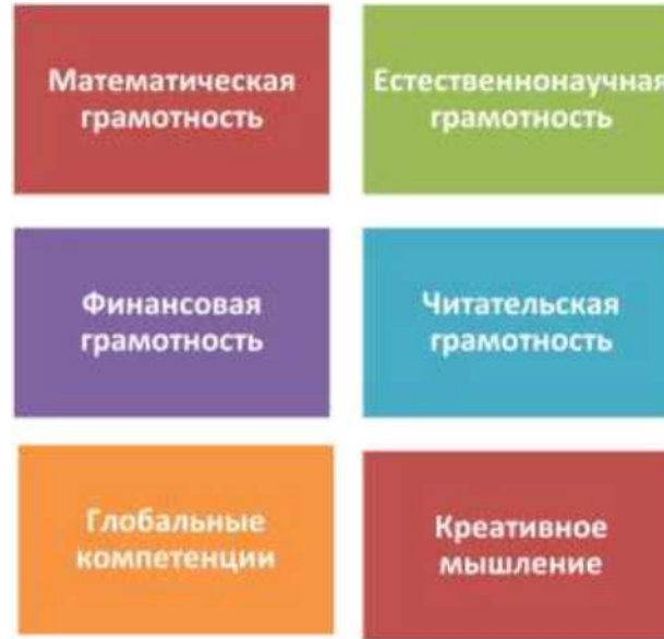
Формы функциональной грамотности